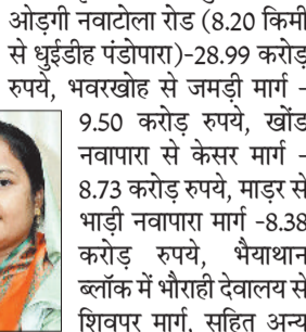
कैबिनेट मंत्री के प्रयासों से मिली प्रशासनिक स्वीकृति

सकेगी। स्वीकृत कार्यों में प्रमुख रूप से- ओड़गी नवाटोला रोड (8.20 किमी से थूईडीह पंडोपारा)-28.99 करोड़ रुपये, भवरखोह से जमड़ी मार्ग - 9.50 करोड़ रुपये, खोंड नवापारा से केसर मार्ग - 8.73 करोड़ रुपये, माडर से भाड़ी नवापारा मार्ग -8.38 करोड़ रुपये, भैयाथान ब्लॉक में भौराही देवालय से शिवपुर मार्ग, सहित अन्य महत्वपूर्ण सड़कों को स्वीकृत प्रदान की गई है। सड़क निर्माण कार्यों की स्वीकृति पर श्रीमती लक्ष्मी राजवाड़े ने कहा कि क्षेत्र का समग्र विकास और जनता को बेहतर सुविधाएं उपलब्ध कराना हमारी प्राथमिकता है। 150.56 करोड़ रुपये की लागत से स्वीकृत ये सड़कें ग्रामीण अर्थव्यवस्था को मजबूती प्रदान करेंगी। किसानों, छात्रों एवं आम नागरिकों को आवागमन में हो रही समस्याओं से राहत मिलेगी। सभी निर्माण कार्य गुणवत्तापूर्ण एवं समय-सीमा के भीतर पूर्ण कराये जाएंगे।